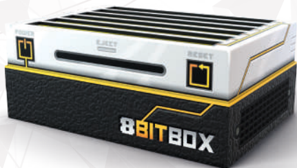
1 игровая приставка