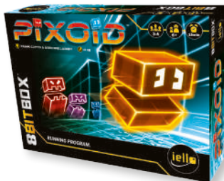
1 игра «ПИКСОИД»