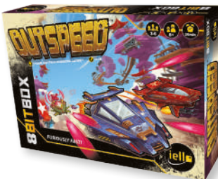
1 игра «СКОРОСТЬ»