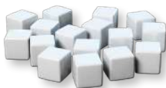
42 белых маркера