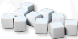
12 больших белых маркеров