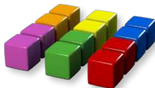
18 цветных маркеров (по 3 маркера шести цветов)