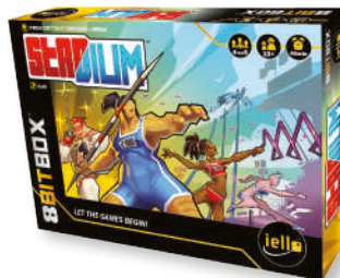
1 игра «СТАДИОН»