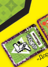
«Дорожка» из карт заданий